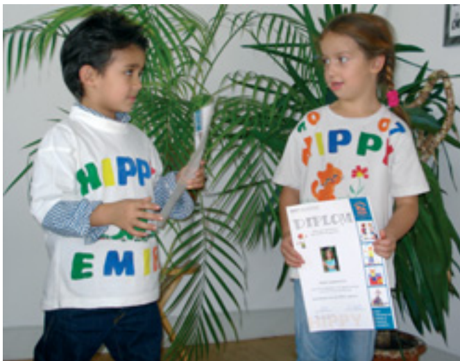
Avec le diplôme HIPPY en forme pour l'école