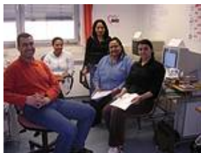
Foto: Teilnehmer des Computerkurses