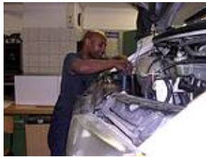
Foto: Qualifizierung in der Kfz-Werkstatt