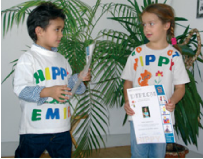
HIPPY-Diplom சான்றிதளுடன் பாடசாலைக்குத் தயாராக்குதல்

கல்வி குடும்பத்திலே ஆரம்பிக்கப்படுகின்றது